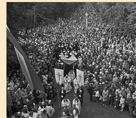
Kreuzwallfahrt 1960, Gemeindearchiv Schellerten

Eingeladen sind ALLE, die mitfeiern möchten!