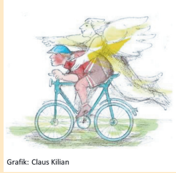
Grafik: Claus Killian

Auf einen Pilgerweg durch das Calenberger Land und die Hildesheimer Börde machen sich alle auf, die gern Fahrrad fahren. Dieser Weg nach Ottbergen ist als innerer Weg, auf dem Gott die Pilger begleitet, durch geistliche Impulse geprägt.